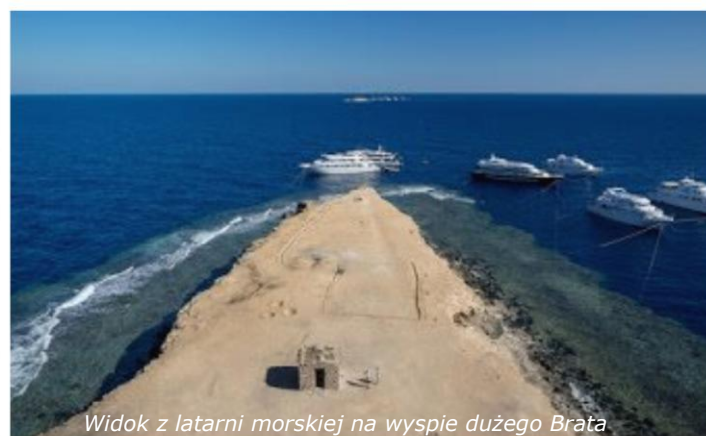
Widok z latarni morskiej na wyspie dużego Brata

„Top północy” to trasa Safari łącząca najpopularniejsze miejsca nurkowe północnej części Morza Czerwonego. W ciągu tygodnia odwiedzimy leżące na otwartym morzu Wyspy Braci ( Brother Islands ) oraz zanurkujemy